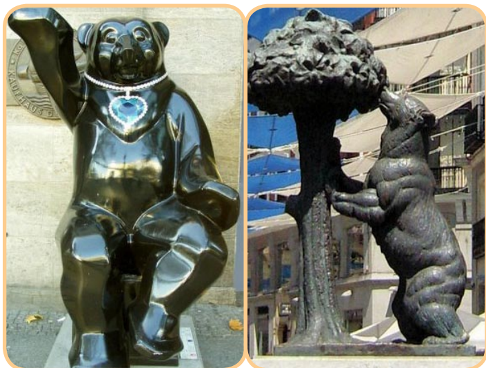
LINKS: BEER VAN BERLIJN | RECHTS: BEER VAN MADRID

Reacties kunnen worden gestuurd naar: inform@netherbears.nl